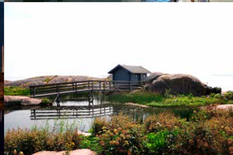
59° 49', 22° 58'

Oy Itämeren Portti-Östersjö Port Ab • Smultrongrund, 10900 Hanko, Finland tel: +358 400 544 164 e-mail: info@itamerenportti.fi • www.itamerenportti.fi